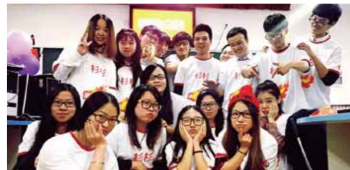
携手衫衫共战双十一