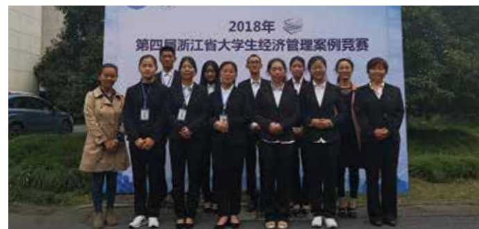
浙江省大学生经济管理案例大赛一等奖