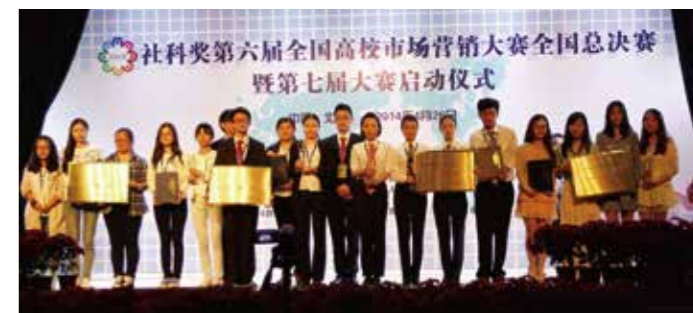
全国高校市场营销大赛获一等奖学科竞赛是亮点