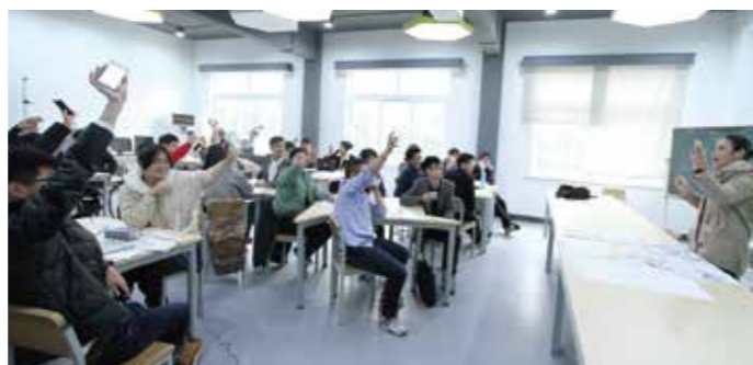
开展翻转课堂教学