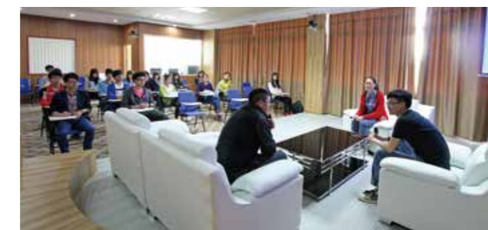
学生在录播室研讨