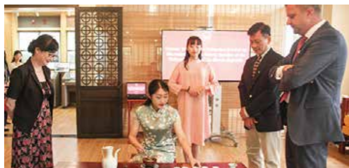
为外宾展示茶道、香道教学成果