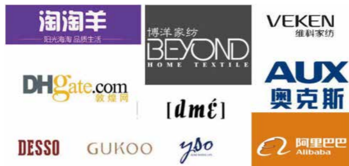
电子商务部分校企合作单位

电子商务概论、电子商务运营与管理、跨境电子商务基础与实践、物流与供应链管理、商务数据分析等