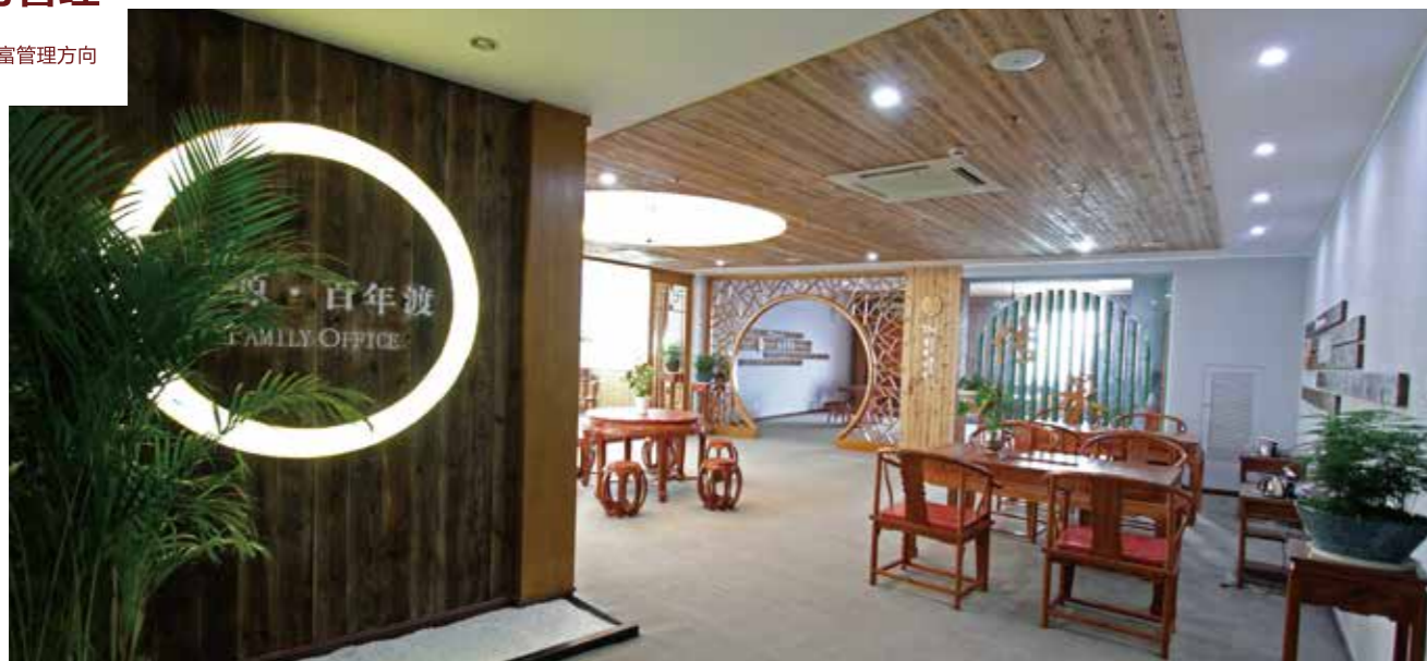
家族财富管理研究院