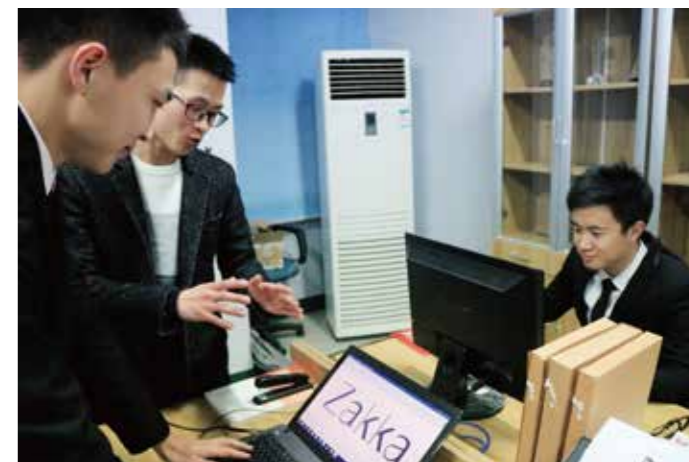
产学研一体的秘书事务所