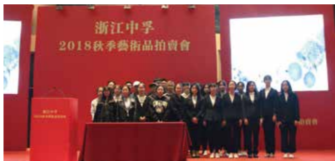
学生参加拍卖会实习