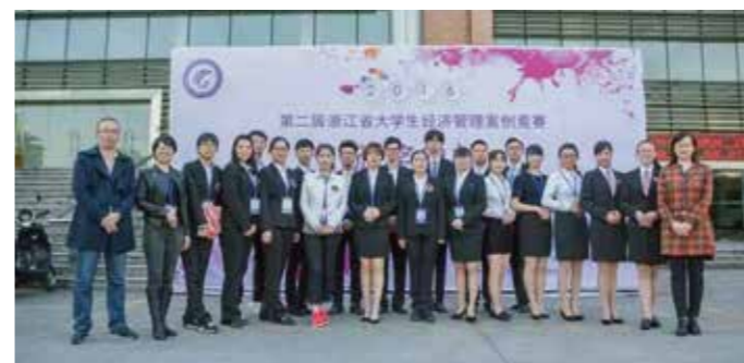
浙江省大学生经济管理案例大赛一等奖