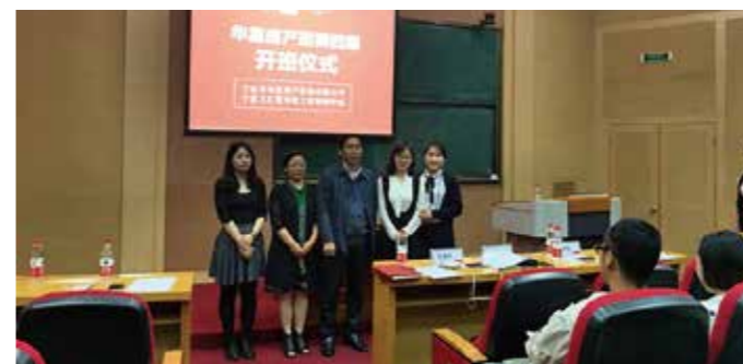
华星房产开班仪式