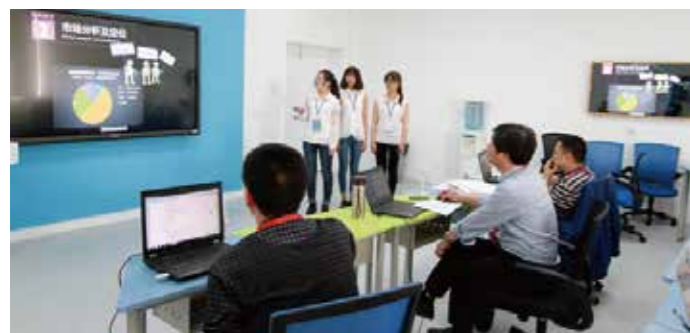
浙江省第十一届大学生电子商务竞赛一等奖