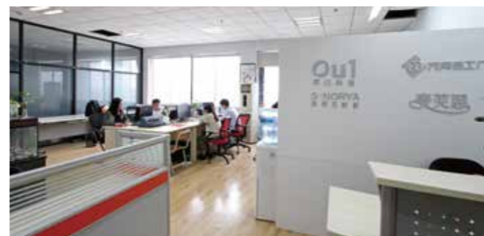
万网电子商务建设工作室