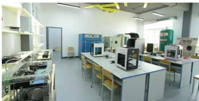
匠心创客空间快速成型实验室

设计表达II、计算机辅助设计I、计算机辅助设计II、计算机辅助设计III、人机工程学、产品创新设计、产品形态设计、产品系统设计等