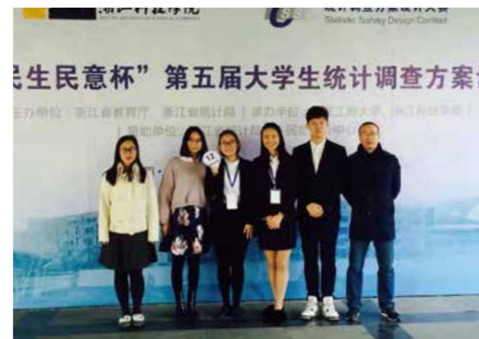
信息管理与信息统计大赛连续获得一等奖