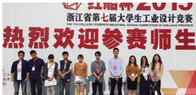
浙江省工业设计竞赛一等奖