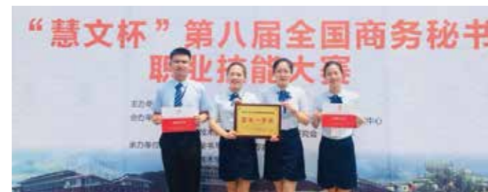
2018年第八届全国商务秘书职业技能大赛团体一等奖

秘书学、应用写作、基础写作、公关关系、档案管理学、基础会计、财务管理、办公自动化、现代商务礼仪、领导科学、企业管理、现代汉语、古代汉语、中国古代文学、中国现当代文学、中国文化概论、法学概论等