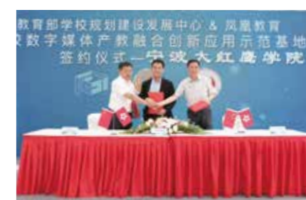
教育部“高校数字媒体产教融合创新应用示范基地”

学校注重打造服务区域新经济发展的财经学科特色，现有35个本科专业，形成了以经济、管理学科为主，经、管、工、文、艺等多学科协调发展的学科专业体系，学校着力培养具有创新精神和创业能力的中小企业中高端技术、管理岗位高素质应用型人才。现有省一流学科4个，市重点学科5个，省重点专业、优势专业和新兴特色专业建设项目共11个，市品牌、特色、优势等重点专业建设项目共8个；2018年与北京电影学院共建北影影视艺术学院。历届毕业生初次就业率均在96%以上，毕业生创业率在全省本科院校中名列前茅，学校创业学院被列为“浙江省普通高校示范性创业学院”。